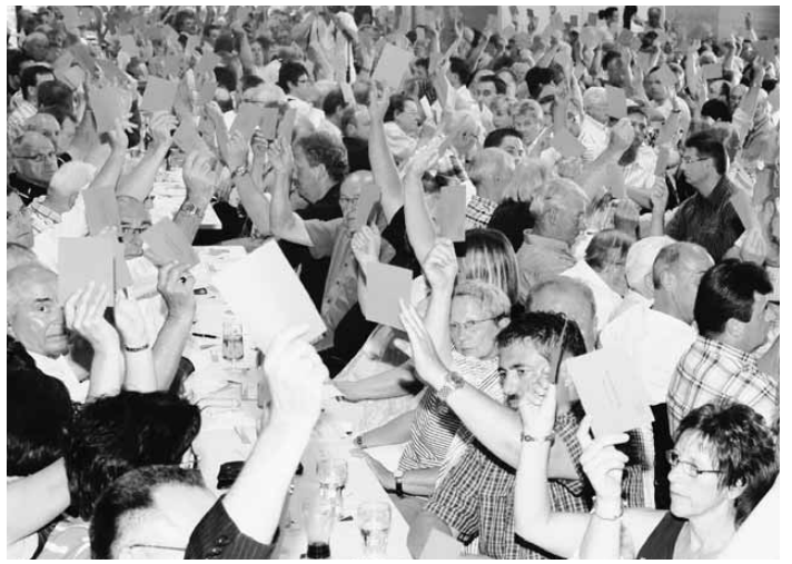
Sie üben schon mal für die spannende Kandidatenwahl später am Abend: CDU-Delegierte bei einer Abstimmung zur Geschäftsordnung in der Bitburger Stadthalle.

Ein Pulk aus Fotografen und Kameraleuten tummelt sich um den Kreisvorsitzenden Billen, als er ans Mikrofon tritt und die Sitzung eröffnet. Ganz Profi, begrüßt er die Spitzenkandidatin Klöckner besonders herzlich, obgleich die ihm zuvor ausgeschlagen hat, mit ihm Seite an Seite in die Stadthalle einzuziehen. Die nach Ortsverbänden aufgeteilte Sitzordnung spiegelt das Sympathiegefälle: Viele Mitglieder aus dem Nordkreis setzen auf „ihre“